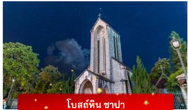
โบสถ์หิน ซาปา